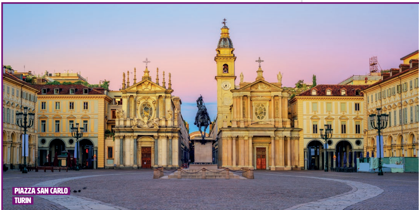
PIAZZA SAN CARLO TURIN