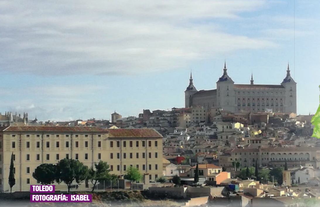
TOLEDO FOTOGRAFÍA: ISABEL