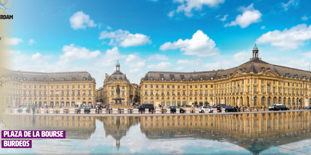
PLAZA DE LA BOURSE BURDEOS