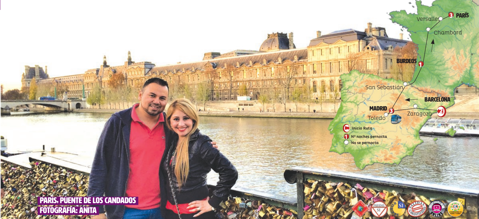
PARIS. PUENTE DE LOS CANDADOS