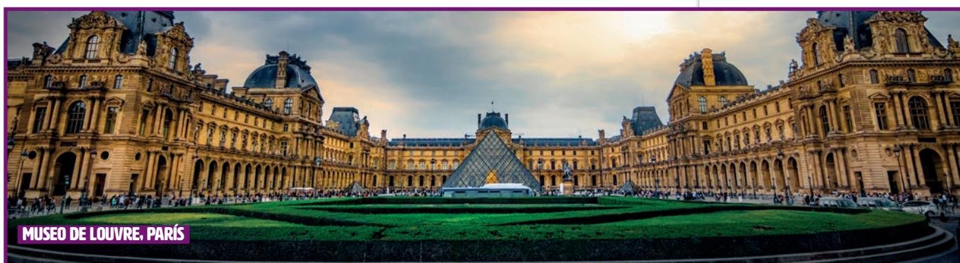
MUSEO DE LOUVRE, PARÍS