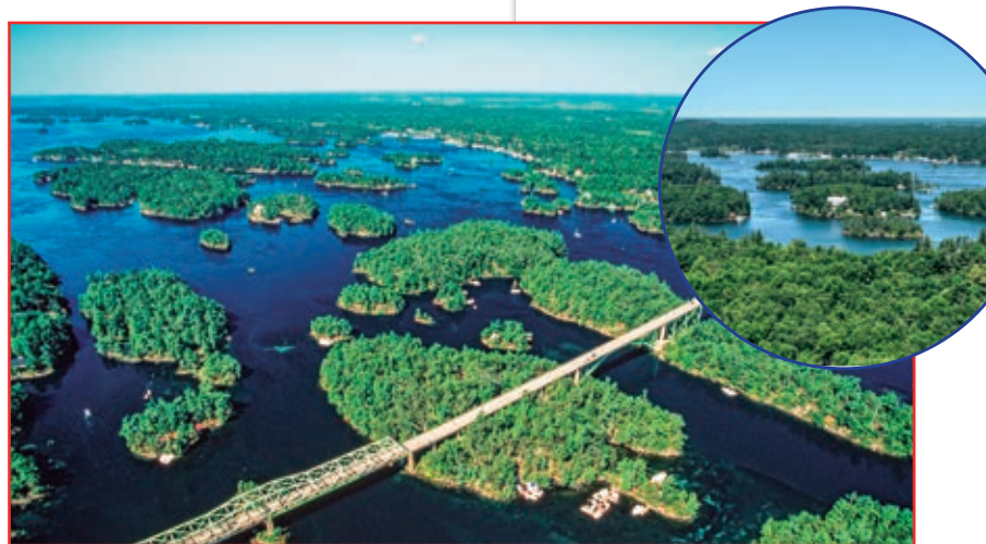
TOMAREMOS UN CRUCERO PANORÁMICO, CON ESPECTACULARES PAISAJES DEL RÍO ST. LAWRENCE Y LAS 1000 ISLAS.