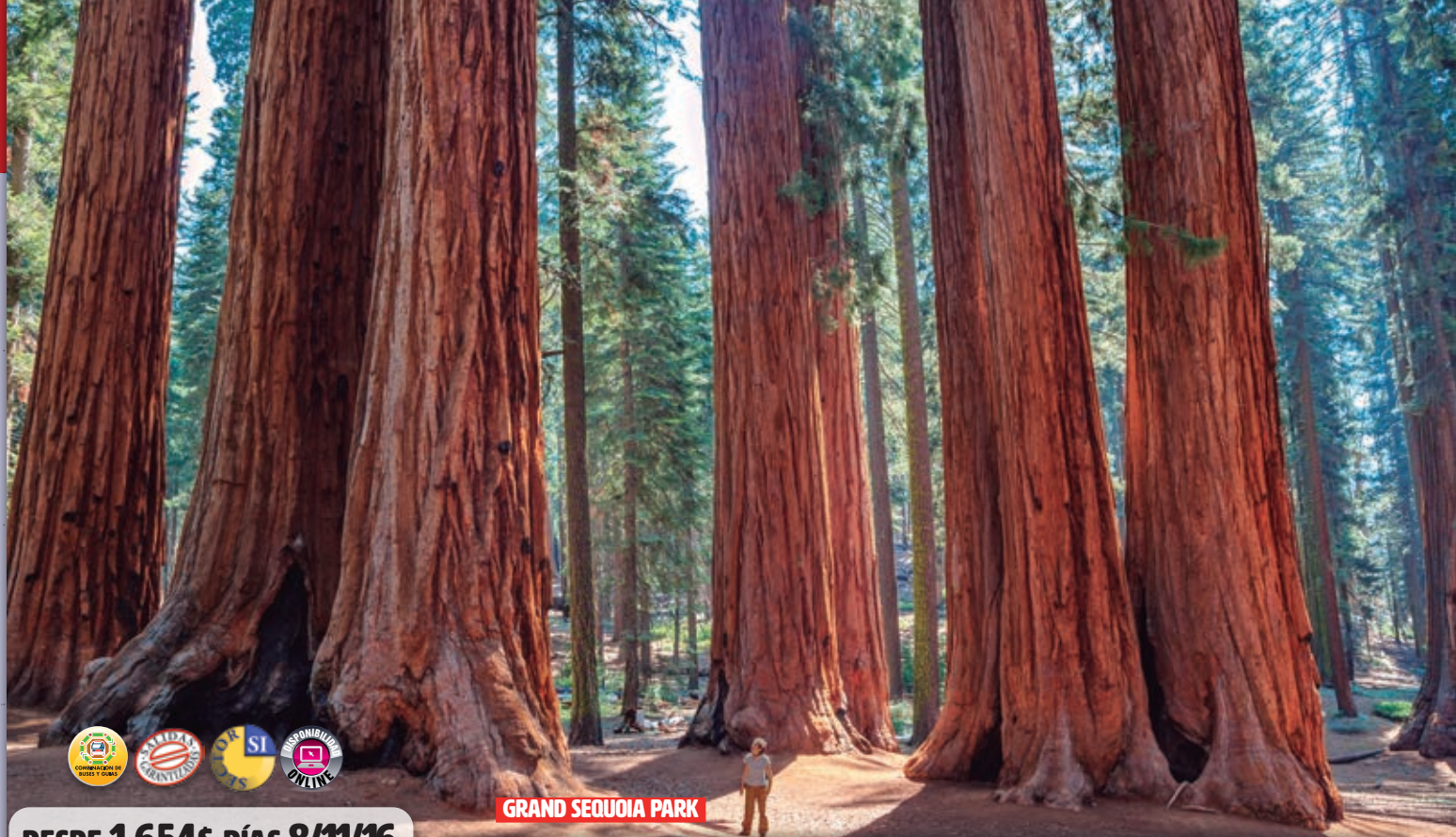
GRAND SEQUOIA PARK