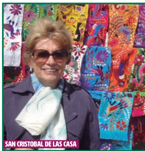
SAN CRISTOBAL DE LAS CASA

Etapas de hermosos paisajes de montaña en el interior de Chiapas , zonas habitadas por comunidades que han mantenido su lengua y tradiciones de origen Maya. Una parada en OCOSINGO , la capital regional. Tras ello seguimos a AGUA AZUL , entrada incluida al Parque Nacional, almuerzo incluido y tiempo para caminar o bañarse entre las más de 50 cascadas de