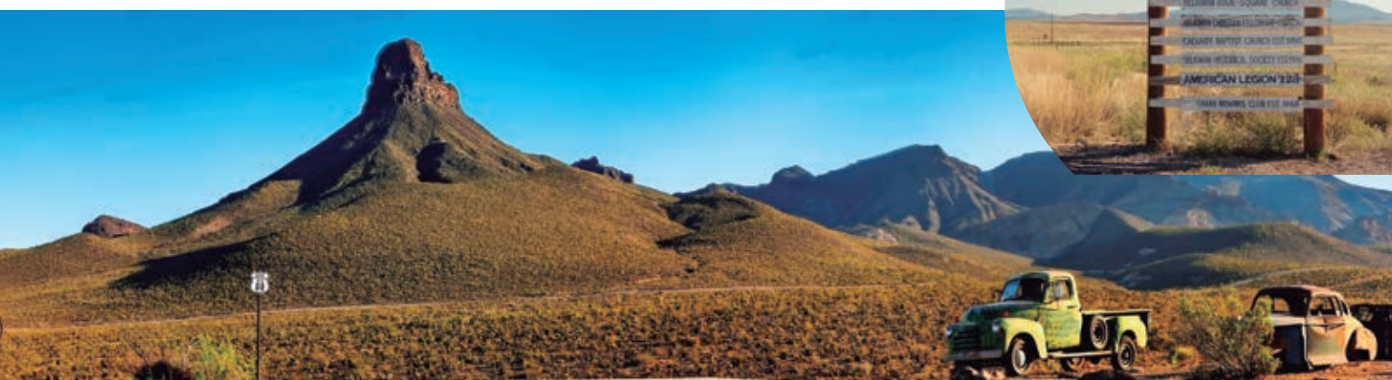
ROUTE 66 IN ARIZONA . SELIGMAN